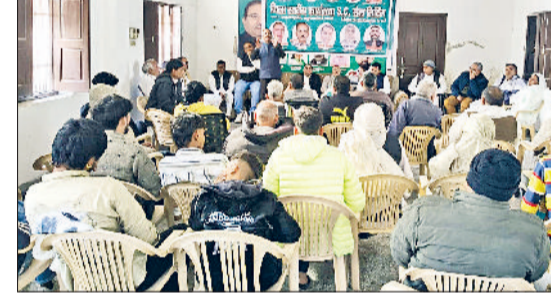
भिवाणी। आयोजित मीटिंग में उपरिष्ठ पार्टी के पदाधिकारी।

भविष्य के लिए परेशानी पैदा करने के लिए दोनों गांवों के रास्तों को उनकी सीमा से सौ मीटर तक दूर ही बंद कर दिया, जबकी इन गांवों से बहुत बड़े स्तर पर आवागमन है और चकबंदी अधिकारी फैसलें पर बदलाव करने से साफ मना कर रहे हैं। वहीं गांव की फिरनी को सवा दस मीटर चौड़ा करने की बजाय कई जगह मनमर्जी से मात्र छह से सात मीटर चौड़ा ही कर दिया जो भविष्य के लिए बड़ी परेशानी