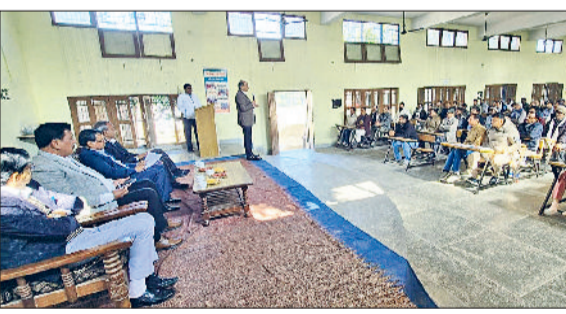
रेवाड़ी। नाहड़ खंड के स्कूलों मुखियाओं को दिशा-निर्देश देते डीईओ।