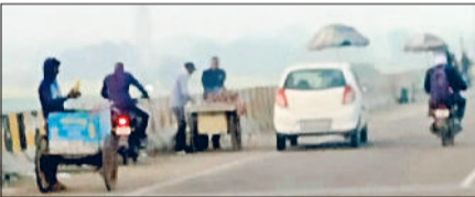
रेवाड़ी। झंजर की ओर जाने वाले बाइपास पर खड़ी रेहड़ियां।

रेवाड़ी। जैसलमेर नेशनल हाइवे से झंजर रोड को जोड़ने वाले आउटर बाइपास के टी-प्वाइंट के पास रेहड़ी वालों ने कब्जा जमा लिया है। बड़ी संख्या में रेहड़ियां खड़ी होने के कारण कोहरे के समय हादसों की आशंका बढ़ रही है। पहले रेहड़ी लगाने वाले लोगों ने नाईवाली चौक फ्लाईओवर के नारनौल की ओर जाने वाले हिस्से पर कब्जा जमाया हुआ था। इससे पुल पर जाम जैसे हालात बने रहते थे। ट्रैफिक पुलिस ने इस स्थान से रेहड़ियों को हटवा दिया था। अब इन रेहड़ी वालों ने बाइपास पर कब्जा जमा लिया है। हरिनगर के पास टी-प्वाइंट पर झंजर की ओर जाने वाले रोड पर दूर तक रेहड़ियां खड़ी की जा रही हैं। इन रेहड़ियों के कारण फ्लाईओवर का एक हिस्सा ही मिनी मार्केट की तरह बनने लगा है। रेहड़ियों पर सामान खरीदने के लिए लोग सड़क पर ही अपने वाहन खड़े करते हैं, जिससे कोहरे के समय खड़े वाहनों से दूसरे वाहनों को निकलने में परेशानी का सामना करना पड़ता है। शाम के समय पुल पर रेहड़ियों कारण लोगों की भीड़ एकत्रित हो जाती है।