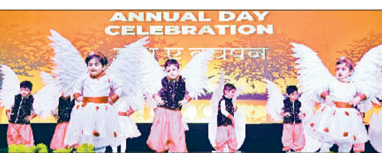
रेवाड़ी। राज स्कूल में सांस्कृतिक कार्यक्रम पेश करते बच्चे।

मंत्रमुग्ध किया। इस दौरान केबीसी के सवालोंने भी सबकी उत्सुकता को बढ़ाया, जिसमें अभिभावकों ने बढ़-चढ़कर भाग लिया। विद्यार्थियों ने सपनों की उड़ान व जश्न ए बचपन थीम पर शंकर जी का डमरू बाजे, आओ तुम्हें चांद पे ले जाएं, अपनी नौ पाठशाला, बादल पे पांव, दिल है छोटा राम, फिर मिलेंगे चलते-चलते, राम, केसरी के लल्ला, देव श्रीगणेशा, मेरे देश की धरती, कह दूँ तुम्हें, डिस्को डांसर,