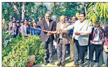
रेवाड़ी। केंवली स्कूल में एनएसएस कैम्प का शुभारंभ करते डीईओ व डीईईओ।