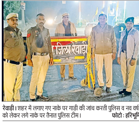
रेवाड़ी। शहर में लगाए गए नाके पर गाड़ी की जांच करती पुलिस व नव वर्ष को लेकर लगे नाके पर तैनात पुलिस टीम।