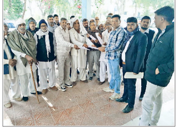
भिवाणी। एसडीएम प्रवाचक को ज्ञापन देते नीमड़ बडेसरा के ग्रामीण।